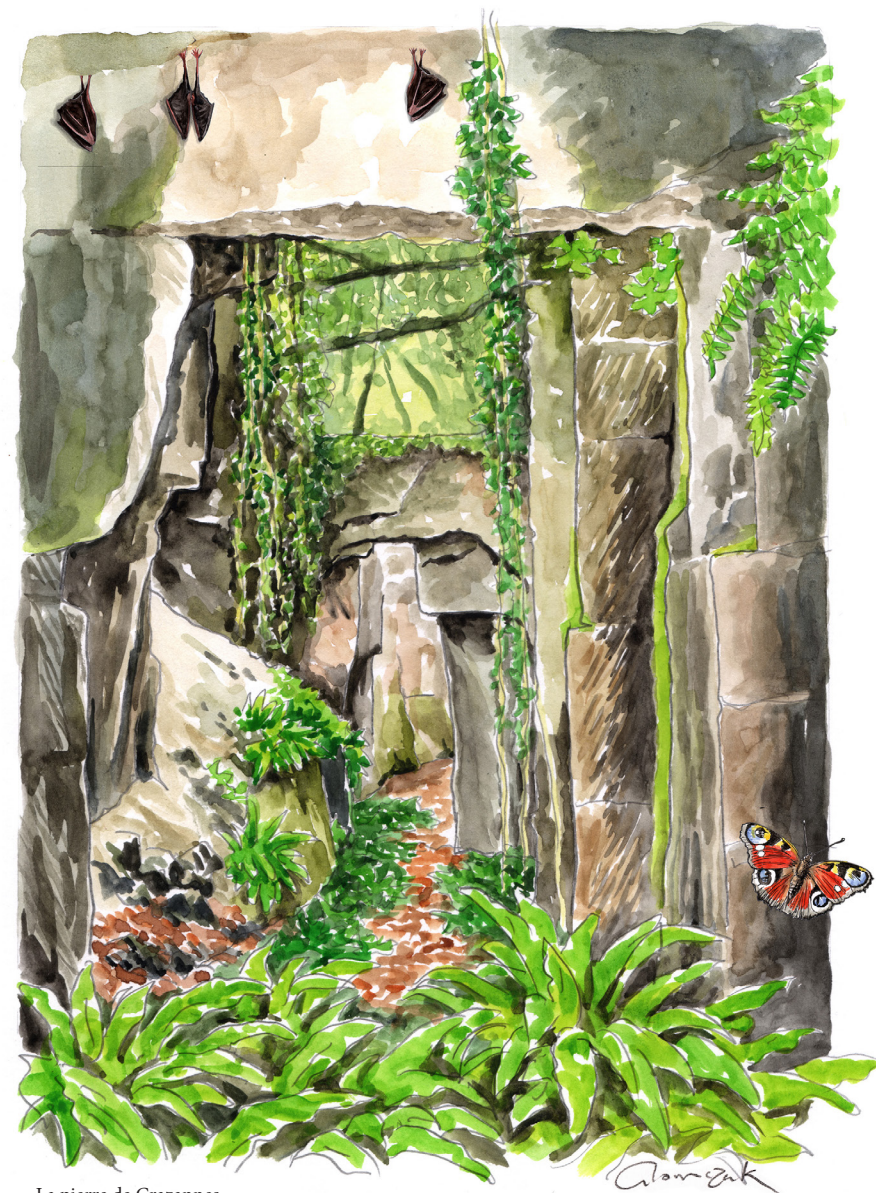
La pierre de Crazannes ENS de Charente-Maritime