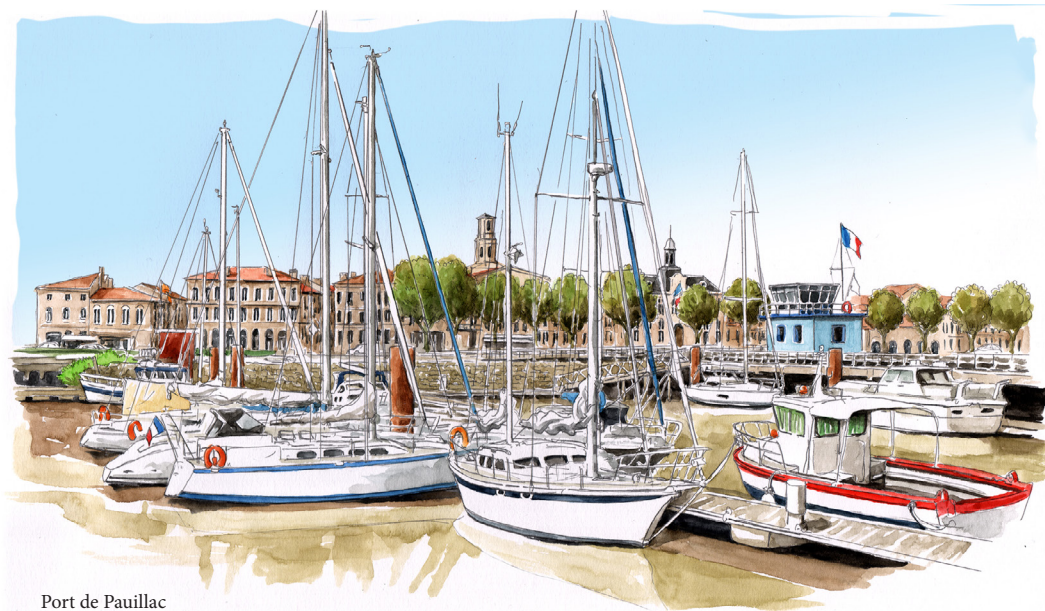
Port de Pauillac