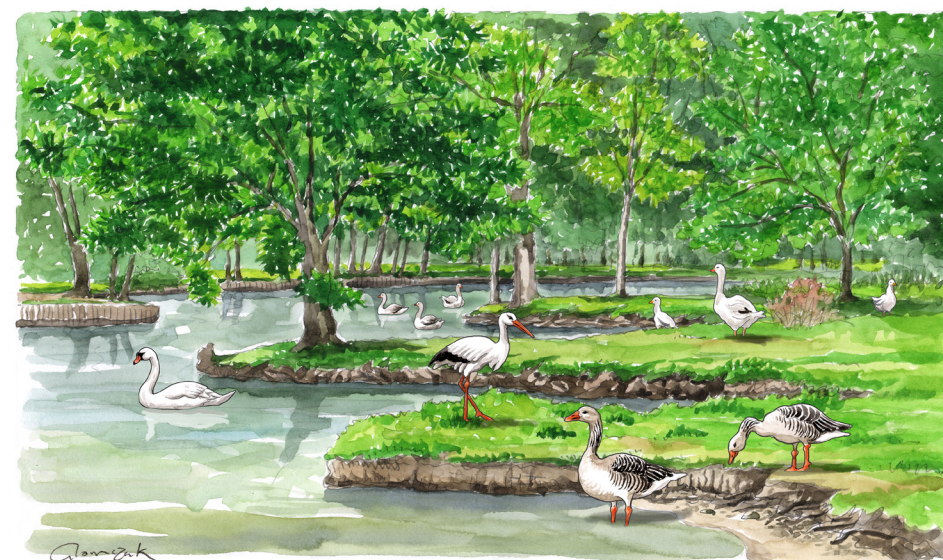
Marais aux oiseaux ENS de Charente-Maritime