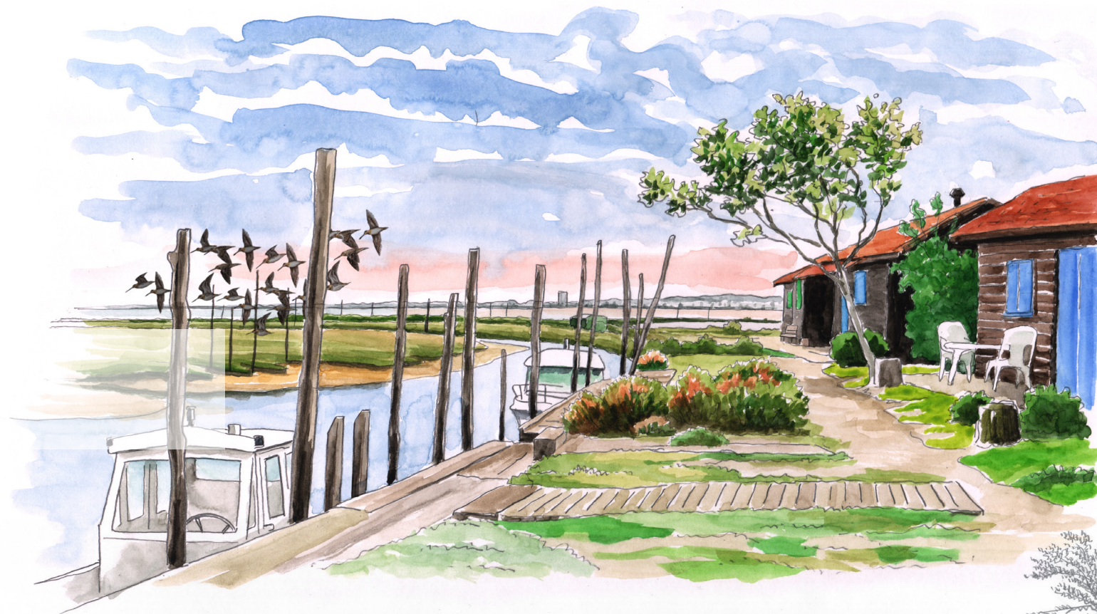
Île aux Oiseaux Bassin d'Arcachon