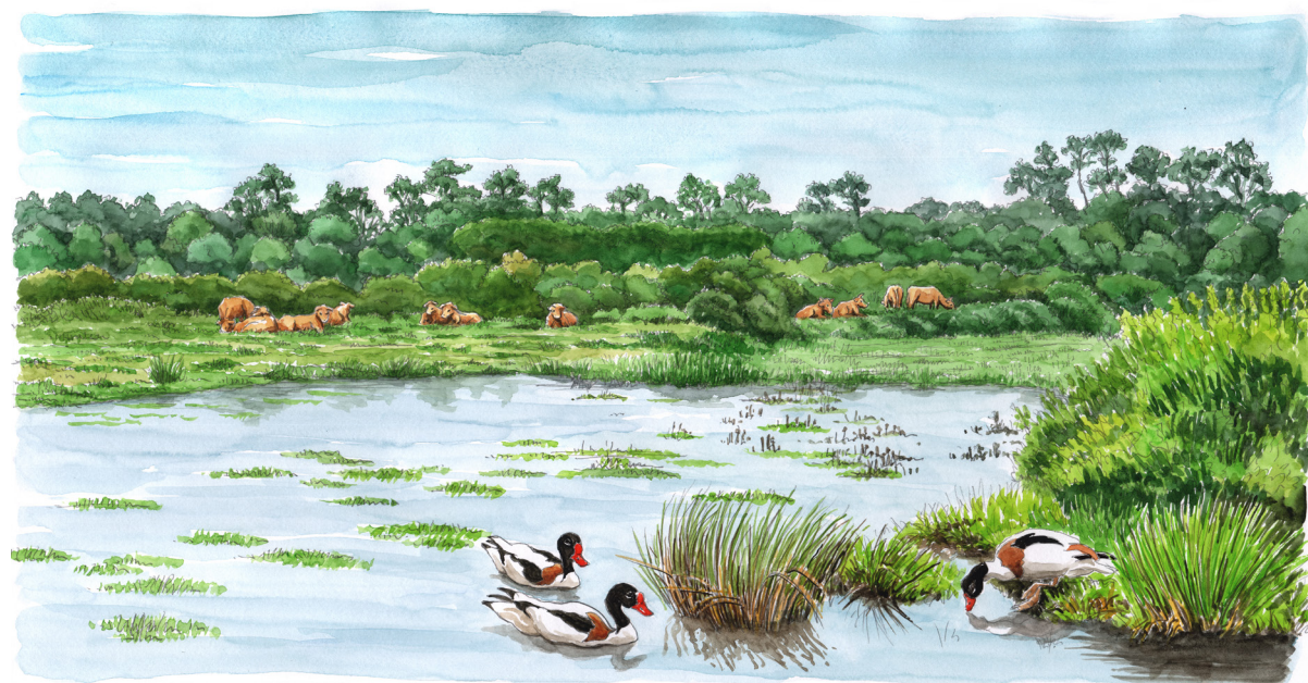
Marais du Logit - Médoc - ENS de Gironde

Réserve naturelle du marais de Moëze-Oléron Charente-Maritime