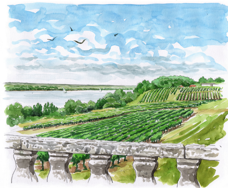
Un balcon sur l'estuaire de la Gironde