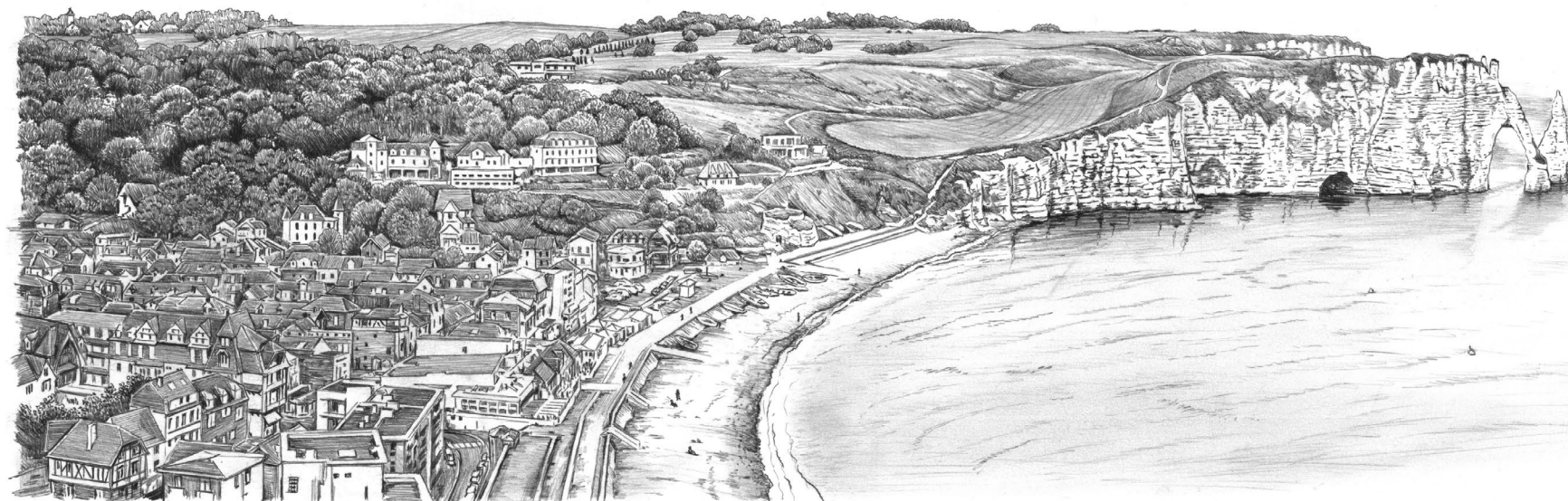
Étretat, les falaises aval - Seine-Maritime