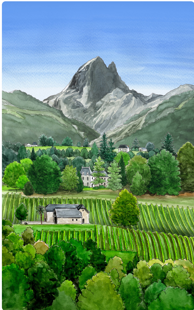
Vignoble de Jurançon et Pic du Midi d'Ossau