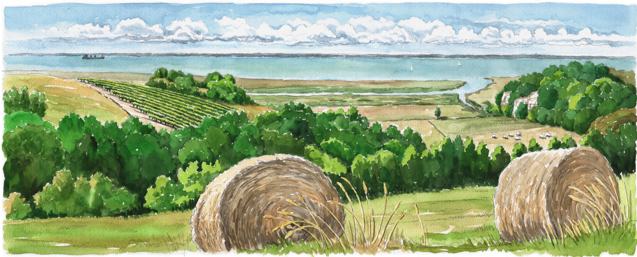
Estuaire de la Gironde.