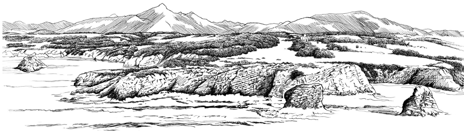
Hendaye, Corniche Basque